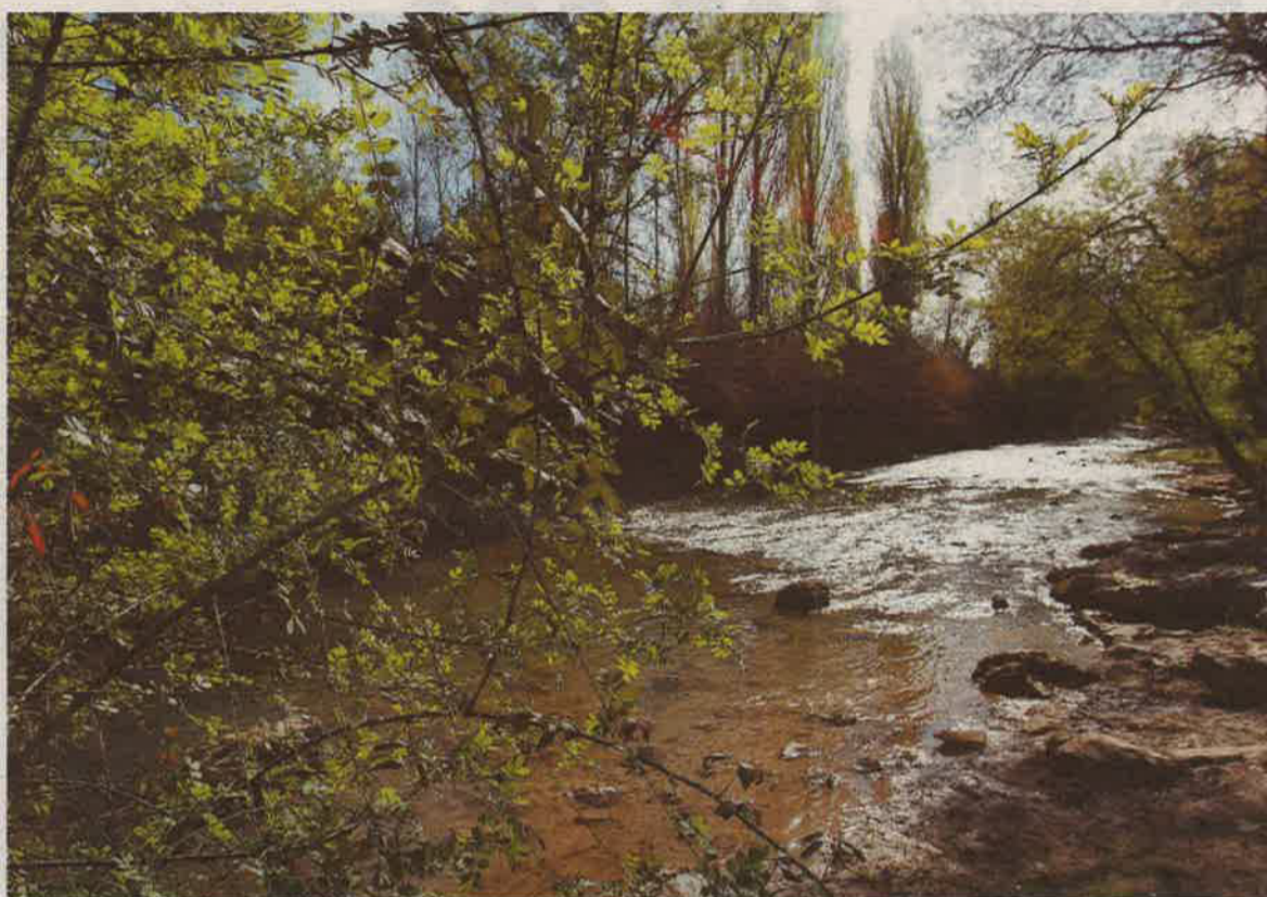
Vista del río Júcar a su paso por la provincia de Albacete.

Los aforos registrados tampoco presentan valores muy elevados. Así, en Valdeganga, el caudal me-