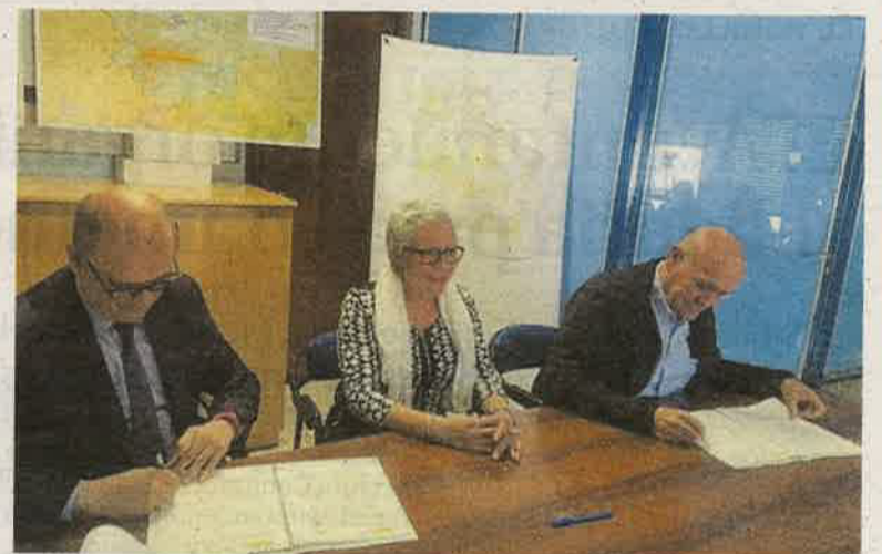
Imagen de archivo de la firma del convenio con Seiasa.

Según la información facilitada por el Seiasa, «las actuaciones previstas cuentan con un presupuesto de 3.869.852 euros (IVA incluido) y contemplan la ejecución de dos estaciones de filtrado, con filtros de malla de ocho pulgadas