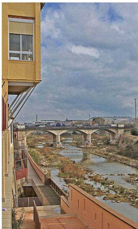
Los expertos reclaman un Consejo de Cuenca que gestione el agua del Serpis | levante-emv

Entre esas medidas, figura la necesidad de crear un Consejo de Cuenca, impulsado por la Administración, que permitiría la participación de todos los agentes, públicos y privados, llamados a planificar la gestión del agua en el río Serpis. Entre ellos, sin duda la