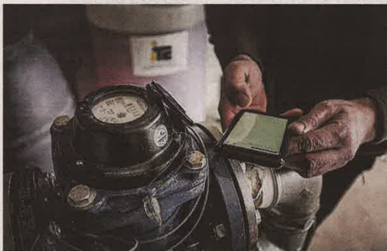
Un agricultor programa un equipo de riego.

«La Jornada pretende ser un foro de encuentro y reflexión de agricultores, técnicos y responsables