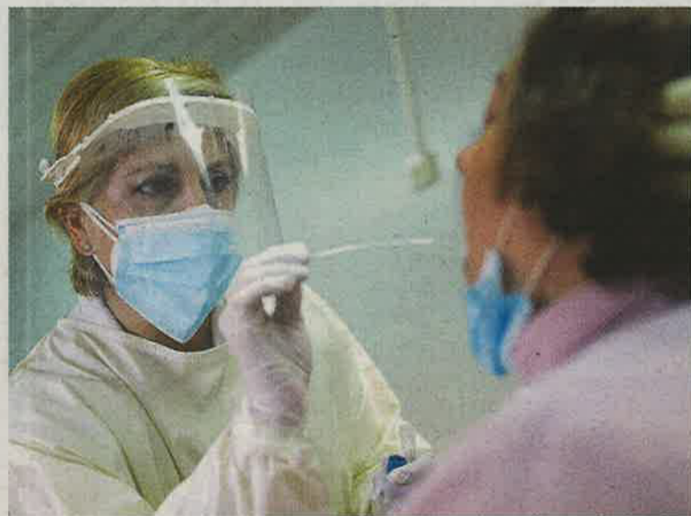
Una enfermera realiza un PCR a un paciente.

FALLECIDOS EN LA REGIÓN. Durante las últimas 24 horas se habían registrado dos fallecidos por coronavirus en Castilla-La Mancha, concretamente en las provincias de Guadalajara y Toledo. En toda la región, el número acumulado de fallecidos desde el inicio de la pandemia son 6.084, hasta 888 de ellos en la provincia de Albacete.