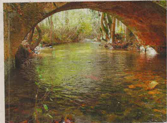
Fotografía de archivo del río Mundo.

El Premio Ríos Muertos 2021 recae esta año en el Scrats, constituido por más de 60 comunidades de usuarios de la zona del Sureste y el Levante, incluyendo el Campo de Cartagena, que «defiende a capa y espada una vieja y obsoleta política del agua que mantiene a las cuencas del Segura y Tajo conectadas por un trasvase irracional e in-