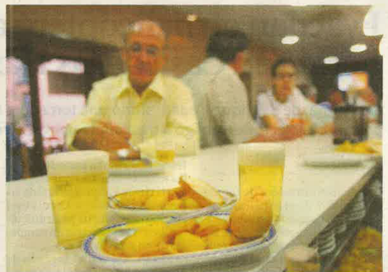
Cañas recién tiradas, unas tapas y una conversación.

Con esta iniciativa, que también ha llegado al madrileño barrio del Pilar y a Las Delicias de Valladolid, Mahou refuerza el papel de los bares como puntos de encuentro imprescindibles para la sociedad.