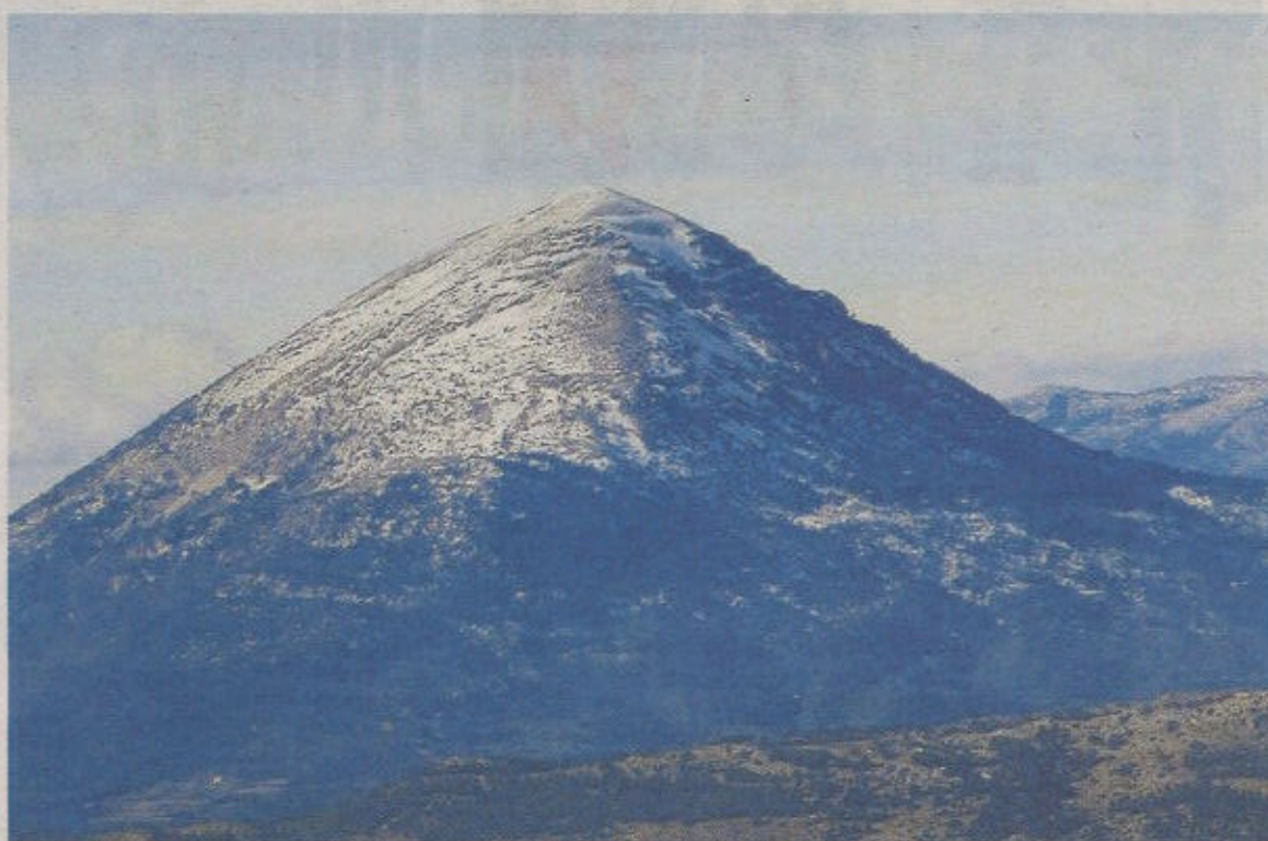
El Pico Atalaya o, simplemente, La Atalaya es el 'techo' de Albacete, con 2.083 metros de altura.

De acuerdo al mismo, el alcance de las obras a ejecutar será «mínimo», pero su diseño tendrá «gran efecto» en la funcionalidad y la eficiencia energética del inmueble,